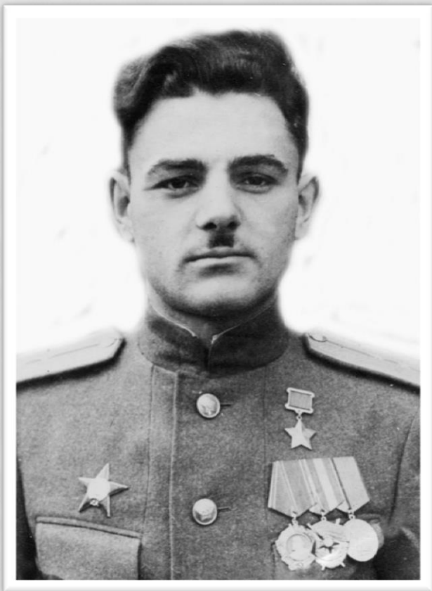
Владимир Карпов в молодости

Зимой 1943 года за боевые заслуги с В. В. Карпова сняли судимость. Вместе с сослуживцами он неоднократно ходил в разведку за линию фронта, откуда приводил десятки «языков», в том числе из офицерского состава. В 1944 году храброго советского лейтенанта удостоили звания Героя Советского Союза. Получив тяжелое ранение, Карпов несколько недель провел в госпитале.