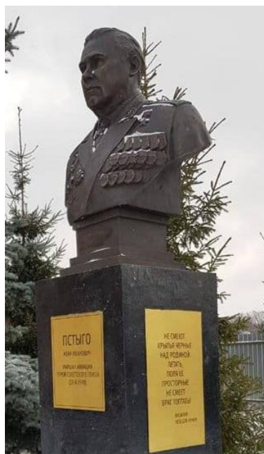
Избранник неба и его след на Земле...