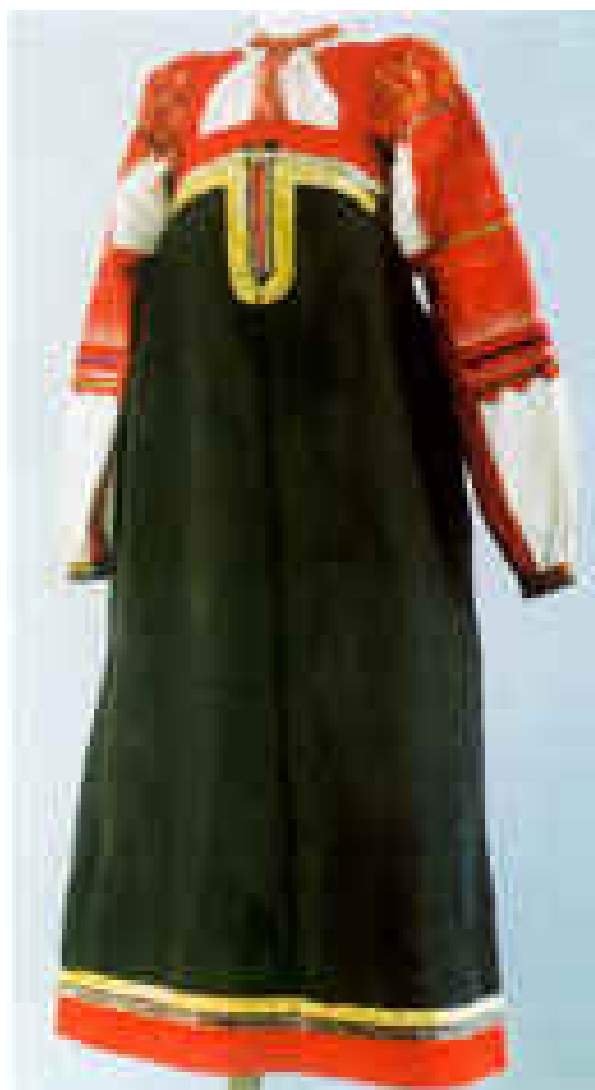
Костюм девичий. Кромской уезд Орловской губ. Шерсть, шелк, сукно, блестки, тесма. Кон. XIX века.

тесма, шелковые ленты, кружева. Праздничные наряды были настолько яркими, что в Дмитровском районе головные уборы получили название «златоглавы».