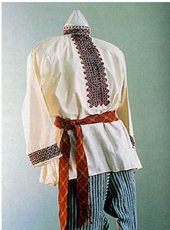
Костюм мужской. Орловская губ. Холст, пестрядь, вышивка «гладь». Кон. XIX – нач. XX вв.

шерстяной ткани или онучного сукна. Рубахи носили навывпуск и подпоясывали узким пояском, к которому, по мере надобности, прикрепляли гребень, дорожный нож или другие мелкие предметы.