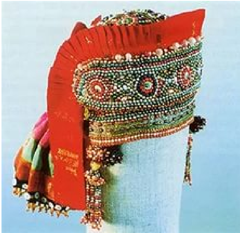
Головной убор к свадебному костюму крестьянки

Распространенный в Ливенском и Новосильском уездах головной убор крестьянки состоял из множества деталей. Новосильский убор, хранящийся в краеведческом музее, включает девять предметов: «гребни» (в Ливенском уезде они носили название «опушины») из шелковых лент, собранных в мелкую сборку и сшитых вместе, бисерное «очелье» со знаками-оберегами, в идее ромбов с продолжающимися сторонами, «позатыль-ник», ленты, венок из бумажных цветов и птичьих перьев, которые должны были отгонять злые силы. Однако, при всей своей сложности, головной убор не был перегруженным.