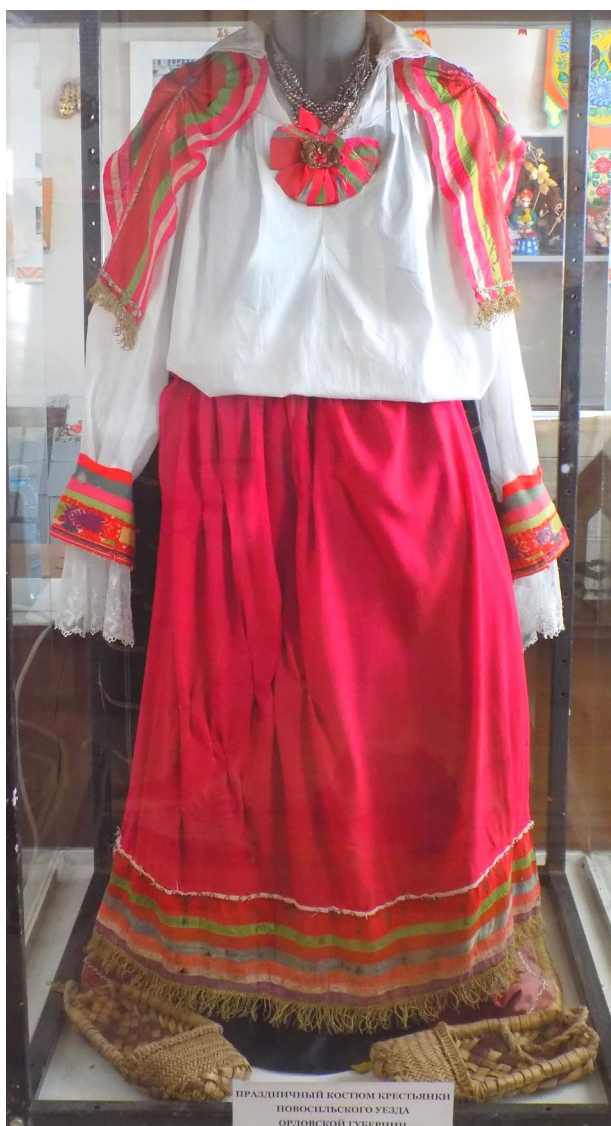
Праздничный костюм крестьянки Новосильского уезда Орловской губ., хранящийся в областном центре

В апреле 2015 года в областном центре детского и юношеского технического творчества прошел фестиваль-конкурс этнографического творчества «Костюм Орловской губернии». Принимали участие в конкурсе школьники Новодеревеньковского, Новосильского, Колпнянского, Ливенского, Сосковского, Должанского и Болховского районов.