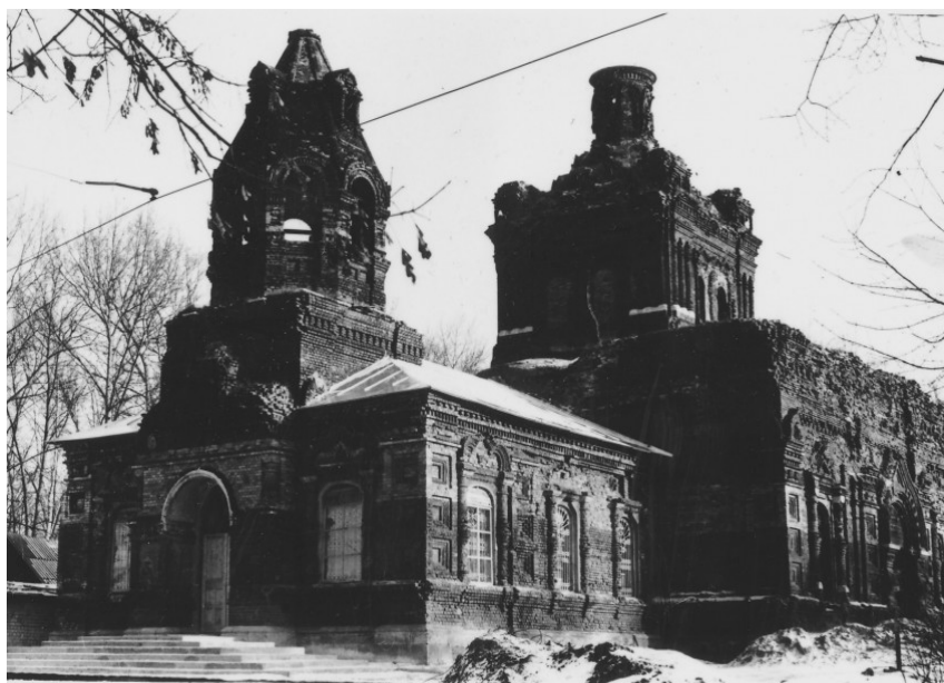
Фотография конца 50-х гг. XX века

После 1917 года начались тяжелые испытания для всей русской церкви. В период с 1921 по 1923 год в Орле были закрыты ряд церквей. Иверская церковь была закрыта в 1923 году. В разное время здесь располагались железнодорожная школа, поликлиника, детский сад. В 1941-43 годы храм сильно пострадал от бомбежки. Разрушение здания продолжалось и после войны, когда оно использовалось под базу ОРСа Орловского отделения дороги: магазин, приемный пункт стеклотары, склад. В 1960-х годах храм предназначался к сносу.