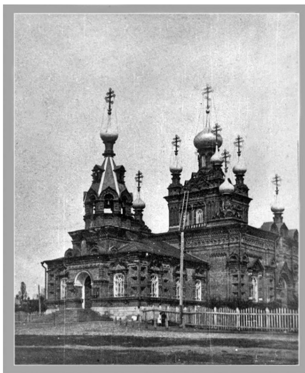
Фотография начала XX века

Входы решены в виде декоративно оформленных порталов, увенчанных с северного и южного фасадов стрельчатой аркой. Общая длина церкви составляет около 44 метров. Размеры четверика храма – 21 на 21 метр.